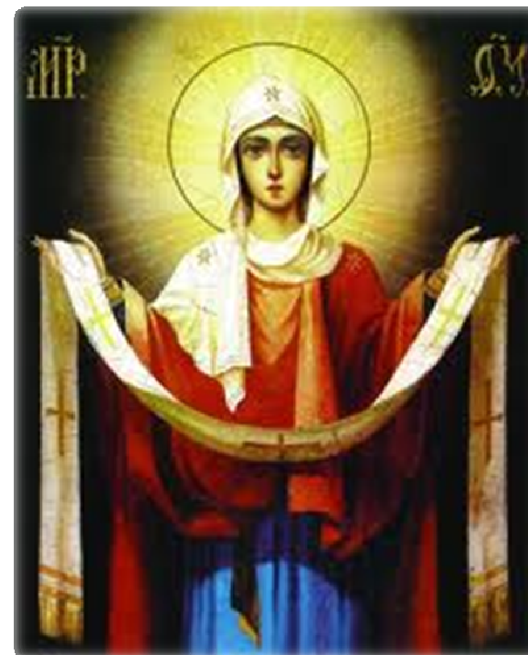
Η ΑΓΙΑ ΣΚΕΠΗ ΤΗΣ ΠΑΝΑΓΙΑΣ ΜΑΣ

Μηνιαία Έκδοση του Ιερού ενοριακού Ναού Αγίου Νικολάου του Νέου Θηβών