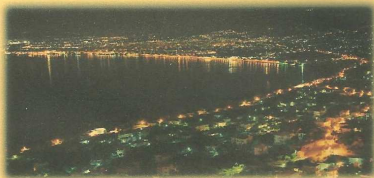
✓ «Υπαπαντή» Καλαμάτας

Πληροφορίες, Πρόγραμμα ,Δηλώσεις συμμετοχής στο γραφείο του Ναού, στην ηλεκτρονική Δ/η www.inagiounikolaoutouneou.gr και στο τηλ:2262024282