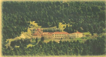
✓ Παναγία Μαλεβή